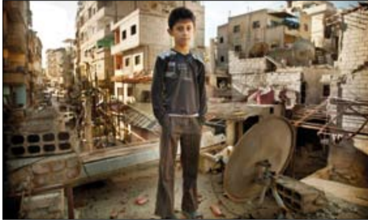
Niño cristiano en un tejado de Damasco (Siria).

En febrero de 2016, los países participantes en la conferencia Supporting Syria and the Region celebrada en Londres definieron un plan de trabajo ambicioso con el fin de responder a las necesidades humani-